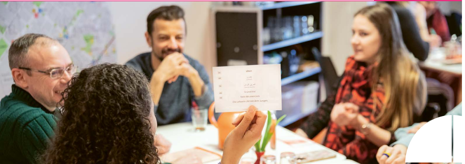
Während des wöchentlich stattfindenden Sprachcafés – eines von vielen Angeboten im Zukunftshaus Wedding