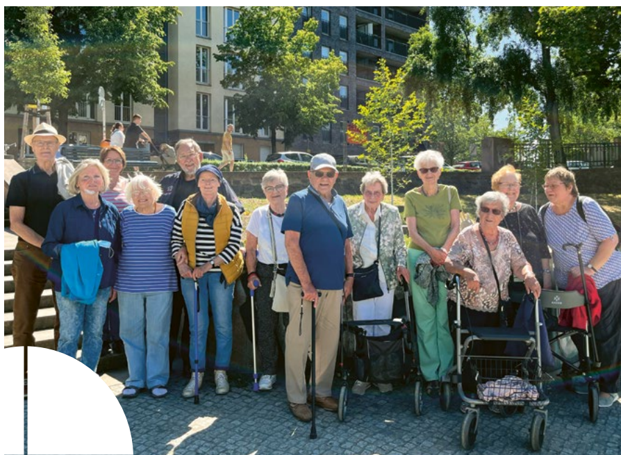
Ankunft an der Schlossbrücke nach der Dampferfahrt.

Auf dem 147. Jahresfest des Paul Gerhardt Stifts ging es am Stand des Servicewohnens lustig zu. Hier konnten