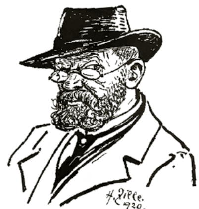
Heinrich Rudolf Zille (1858 bis 1929) – Grafiker, Maler und Fotograf

Mein persönliches Highlight des Jahres war der Zille-Abend Anfang September: Bei diesem Stubentheater ging es vergnügt zu und so ließen sich bald auch die Seniorinnen und Senioren von der ausgelassenen Stimmung anstecken. Es wurde laut gelacht und der eine oder andere Berliner Klassiker mitgesungen.