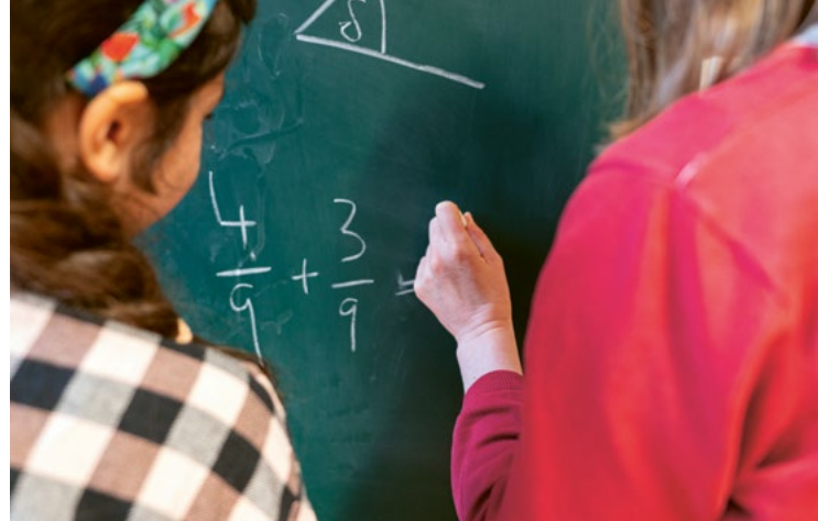
Mädchen bei der Hausaufgabenhilfe im Zukunftshaus Wedding

Die offene Hausaufgabenhilfe geht nahtlos in einen Spielertreff über. Nach getanen Aufgaben können die Kinder spielen und so in Kontakt mit anderen kommen. Manche Kinder