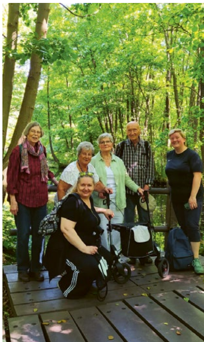
Kleine Pause bei der Wanderung durch das Briesetal.

Im Mai folgte eine Dampferfahrt rund um Moabit. Zwar nur als Ersatz für einen ausgefallenen Tagesausflug gedacht, hat die Fahrt doch viel Freude bereitet – was sicher auch am besten Sommerwetter lag.