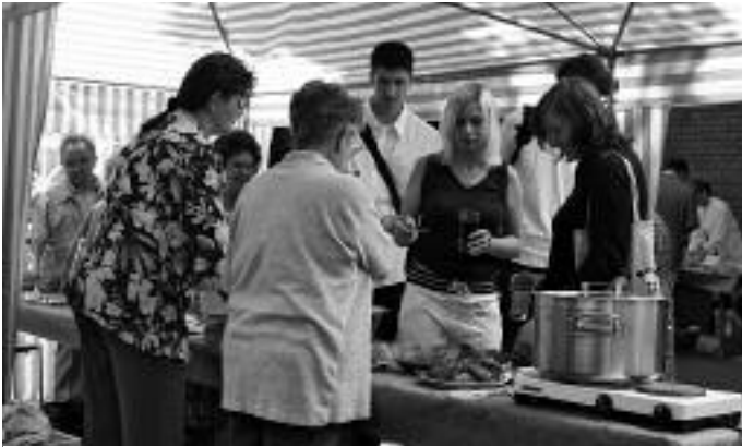
Musik, Information, Begegnung standen im Mittelpunkt des Jahresfestes am 10. Juni.