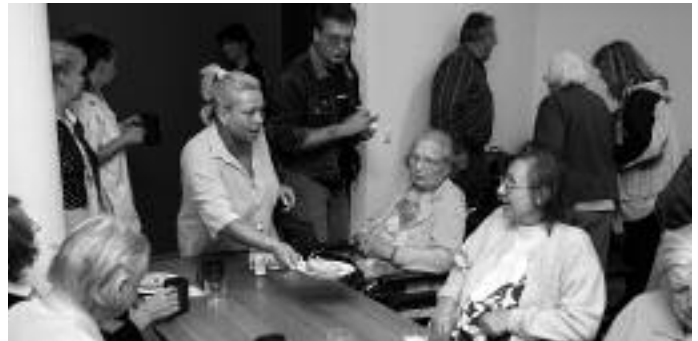
Geschafft. Erschöpft, aber glücklich sind die Bewohner in den neuen Räumen angekommen.

ze mit gerontopsychiatrischem Schwerpunkt. Überwiegend stehen den Bewohnern Einzel- und einige Doppelzimmer mit eigenem Duschbad zur Verfügung. Herzstück jedes Wohnbereiches ist ein großer teilbarer gemeinschaftlicher Wohnraum mit Südausrichtung und Blick auf den Park des Paul Gerhardt Stiftes. Im Foyer der Einrichtung befinden sich eine Cafeteria sowie ein Andachtsraum.