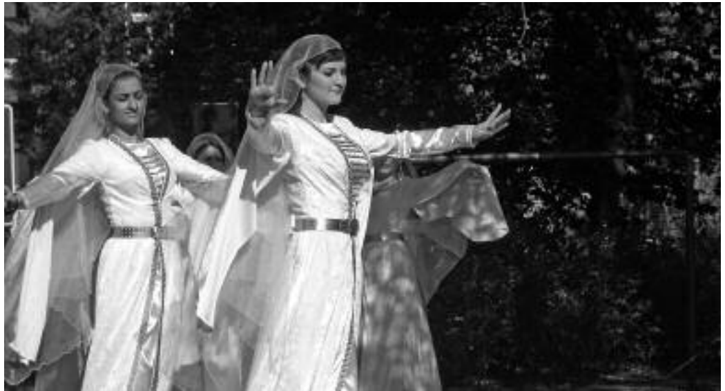
Das Kinderensemble Baschlang begeisterte die Gäste des Erntedankfestes im Johannesstift.

Wir freuen uns, dass nicht nur unsere Projekte Anklang finden, sondern auch das Refugium als Ort des beschützten Wohnens inzwischen auch für Flüchtlinge aus anderen Bundesländern eine Zuflucht wurde. Über die Unterstützung für unsere Arbeit, die in vielfacher Weise bei uns ankommt – ehrenamtliches Engagement, Sach- und Geldspenden, Frei-