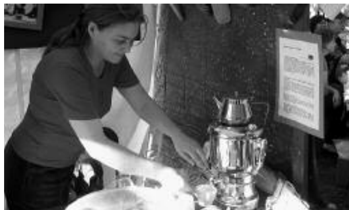
Informationen über das Refugium gab es beim Erntedankfest des Johannesstifts.

Nachdem wir die Leser und Leserinnen in der vergangenen Ausgabe der Notizen über die Zusage zur Förderung einiger unserer Projekte durch das Bundesamt für Migration und Flucht, Aktion Mensch und die Stiftung Mitarbeit informieren konnten, möchten wir nun im Herbst 2006 davon berichten.