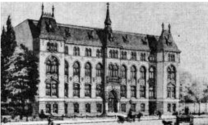
Das Mutterhaus 1888 an der Müllerstraße

(Ke/Ku) Am 7. Juni 1876 gegründet, bestand der Zweck der Stiftung in der Pflege von Kranken, besonders solcher, die in Armut lebten. Den Dienst nahmen Diakonissen wahr, die in einer Dienst- und Lebensgemeinschaft hauptsächlich in Kirchengemeinden arbeiteten.