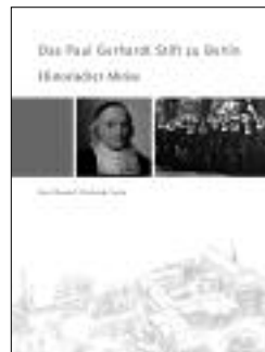
Die Höhen und Tiefen der Geschichte des Paul Gerhardt Stifts sind im „Historischer Abriss“ beschrieben.