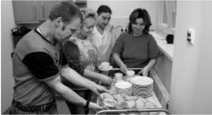
Die Mitarbeiter sorgen für eine Stärkung nach dem anstrengenden Umzug.

Ende Oktober zogen die ersten Bewohner in das Pflegewohnheim am Schillerpark ein